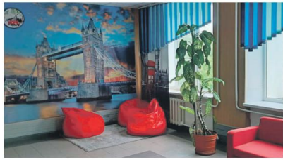
Рекреационная зона в школе № 1