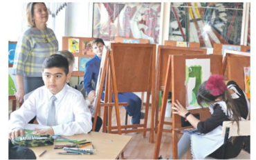
В аудитории школы № 4