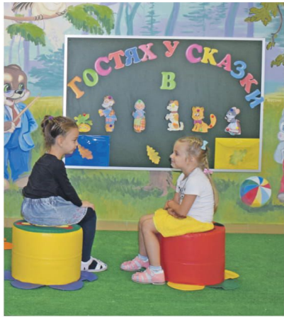
В детском саду № 4