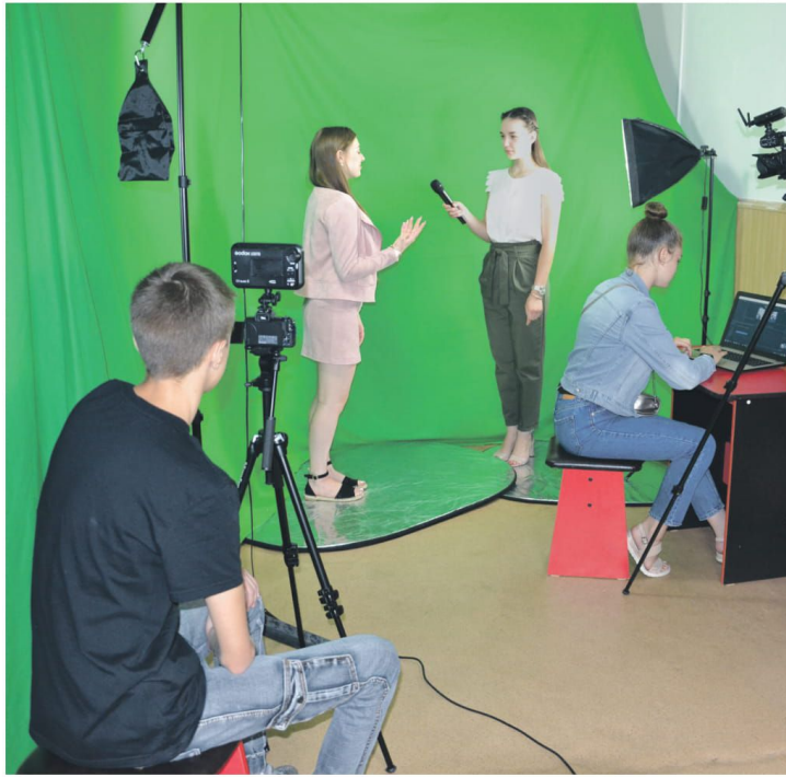
В школьном медиацентре «МедиаДикт» школы № 1