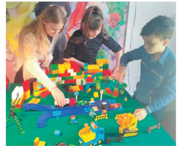
Студия мультипликации в Доме детского творчества