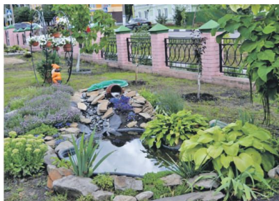
Ландшафтный дизайн на территории школы № 2