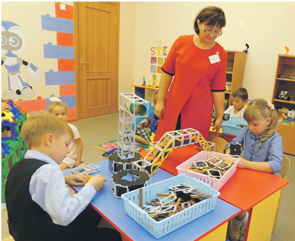
Инженерное образование малышей начинается с конструирования

Школьный технопарк позволяет создать эффективную систему профориентации, популяризовать среди школьников и их родителей востребованные инженерные и технические специальности. И, конечно, помогает выявлять «техно-звёздочек» среди учеников в сетевом взаимодействии образовательных учреждений города.