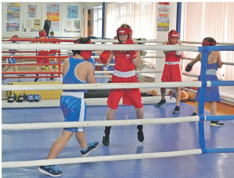
Тренировки по боксу в школе № 4