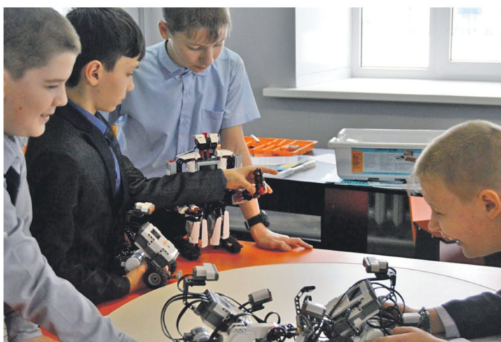
Технопарк в школе № 1

Ещё один важный элемент современной инфраструктуры — создание цифровой образовательной среды. Для решения проблемы взаимоотношений «цифровые ученики и нецифровые» учителя создали школьный медиациентр «МедиаДикт».