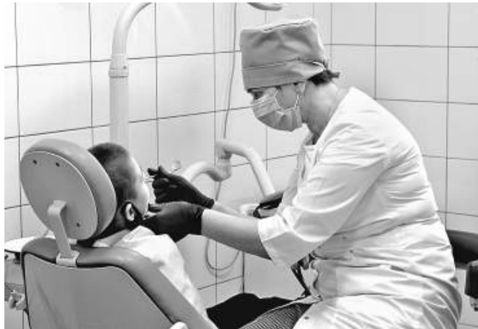
В лечебно-оздоровительном комплексе Корочанской школы-интерната оборудован стоматологический кабинет

Все дети в Корочанской школе-интернате с сохранным интеллектом, так что проблем с их социализацией нет. Но чтобы лучше подготовиться к взрослой жизни, участвуют в проекте «Уроки финансовой грамотности», а в рамках школьной программы на уроках технологии девочки учатся швейному делу (могут они и приготовить несложные блюда: салаты, оладьи, блины...), мальчишки в мастерских — столярному и слесарному. Ученики 10–11-х