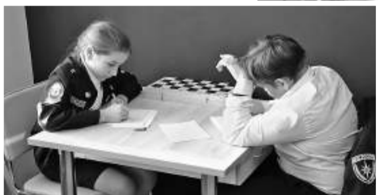
Рассчитать ценность шахматных фигур — задача нелёгкая