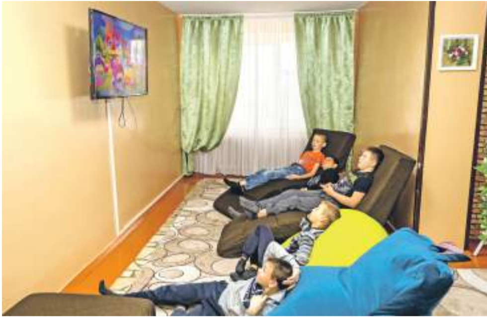
В свободное время можно посмотреть телевизор