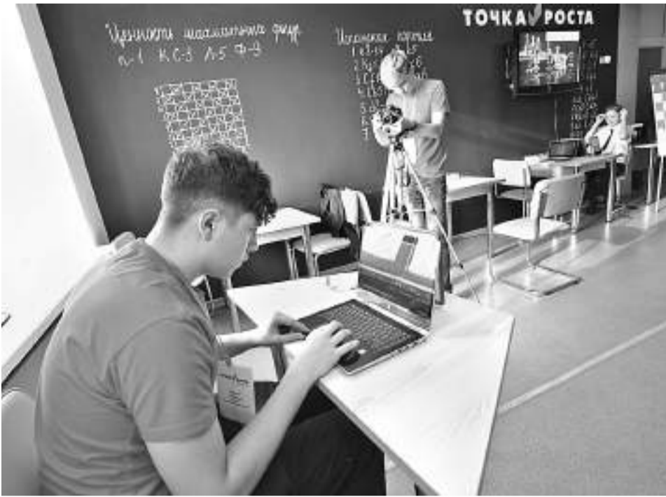
Школьная киностудия «Новое поколение»