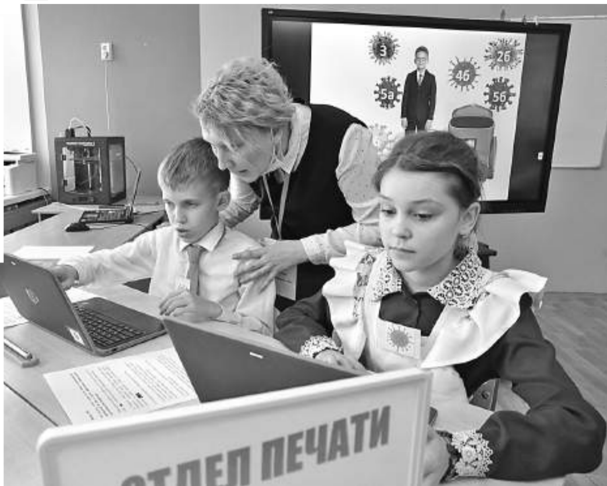
Отделу печати поставлена задача: найти информацию по профилактике коронавируса