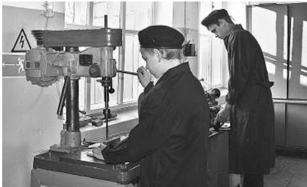
В школьной мастерской мальчишки учатся столярному и слесарному делу