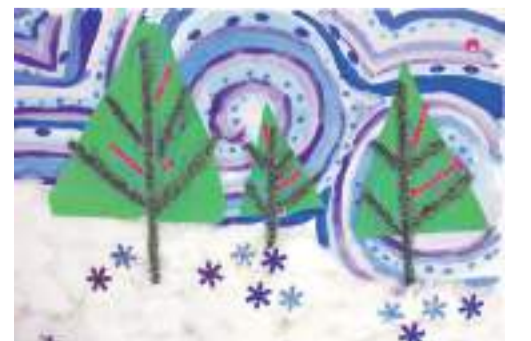
Коллективная работа объединения «Бумажные фантазии»