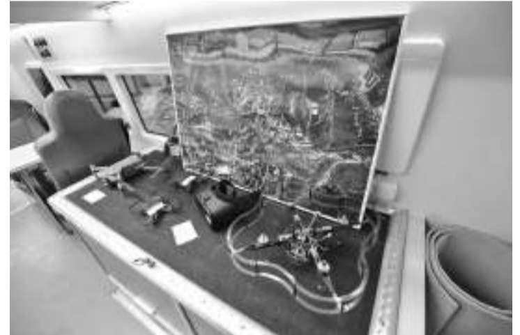
Мобильный «Кванториум» «начинён» современным оборудованием

Планируется, что воспитанники мобильного «Кванториума» будут получать реальные задания от местных предприятий и компа-