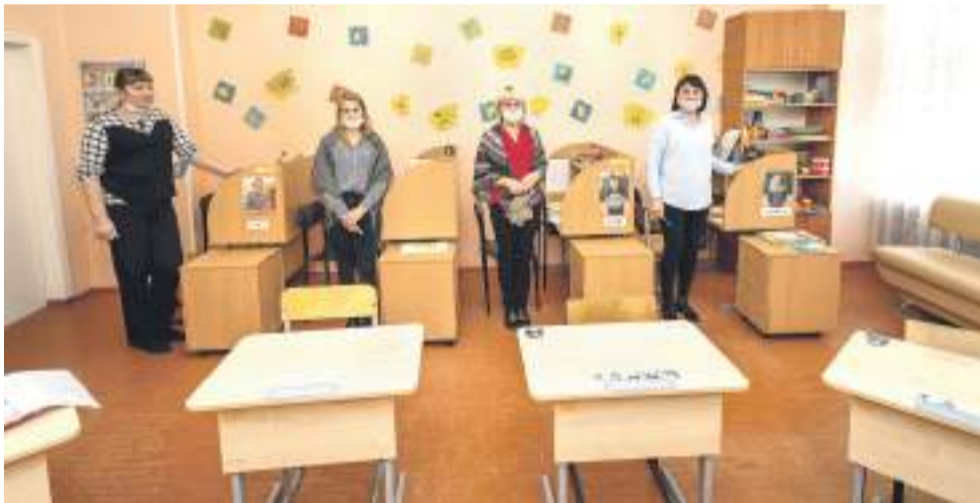
Тьюторы: каждый занимается с одним ребёнком с самыми тяжёлыми проблемами со здоровьем