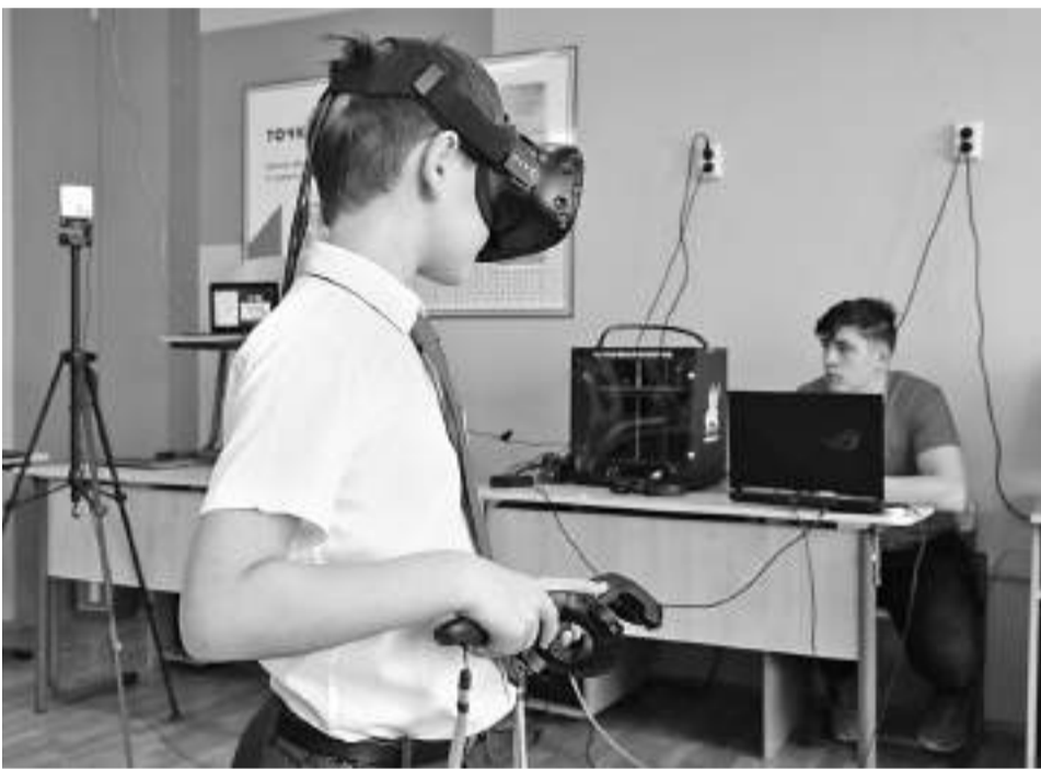
Путешествие вглубь лёгких с помощью очков виртуальной реальности

Старшеклассники Гостищевской школы раз в неделю на математике занимаются на платформе «Учи.ру». На внеурочке этот ресурс тоже активно используется. Нам показали одно из таких занятий: школьники выполняли на ноутбуках задания пробного тура олимпиады Vicsmatch.com+.