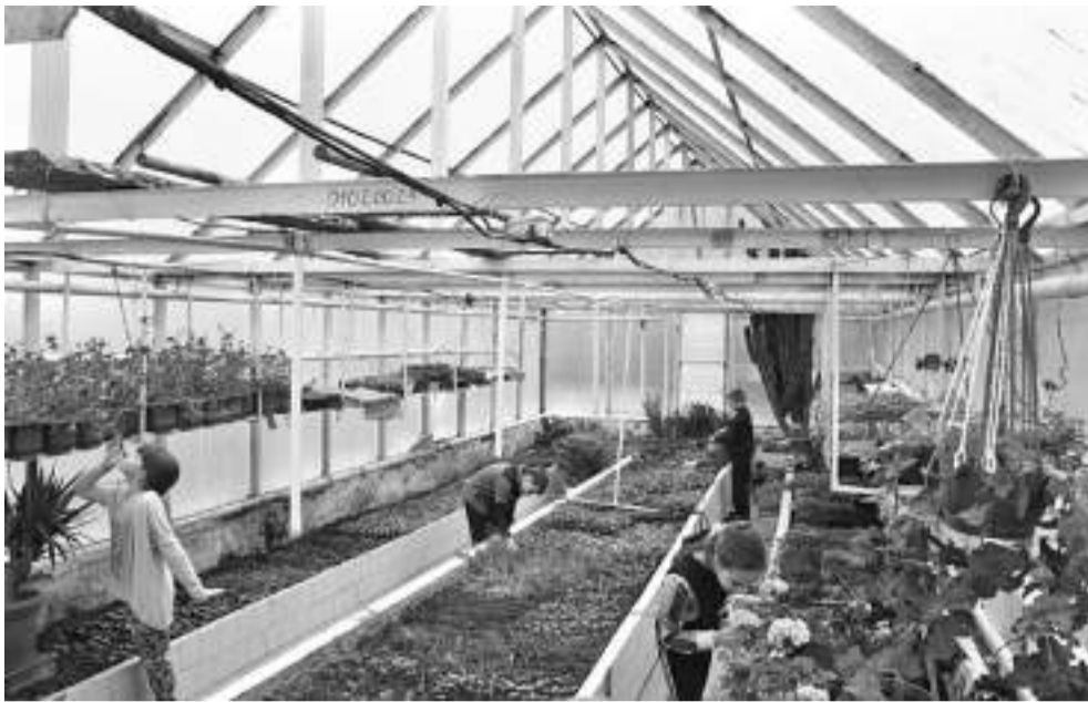
Школа имеет учебно-опытный участок площадью 0,75 га, где выращивают овощи и фрукты. В теплице зимой — зелень, весной — саженцы цветов

класса с современным оборудованием, шесть логопедических кабинетов, комната психологической поддержки, вокальная студия, спортивные и игровые площадки.