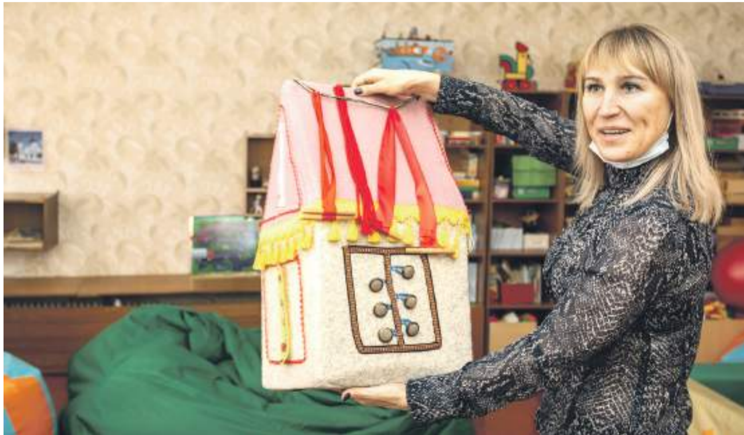
Оборудование для развития мелкой моторики

ПОЧЕМУ В НОВООСКОЛЬСКОЙ ШКОЛЕ-ИНТЕРНАТЕ РЕБЯТАМ ХОРОШО ТАК ЖЕ, КАК ДОМА