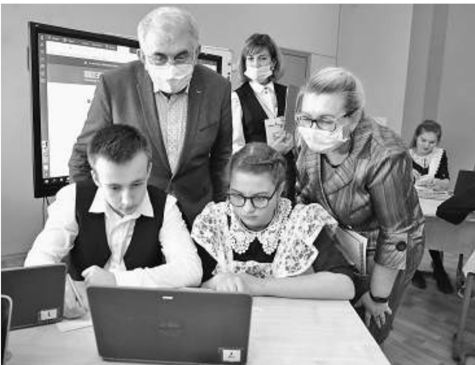
Решать олимпиадные задачи на платформе «Учи.ру» интересно и полезно!