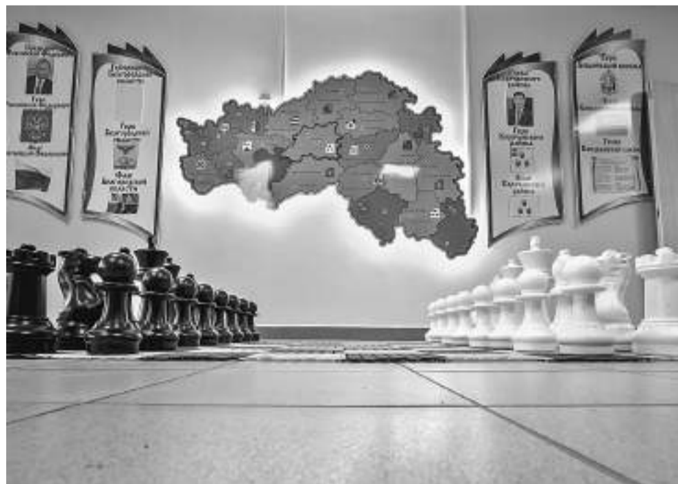
Оформление стен в Коцеевской школе Корочанского района