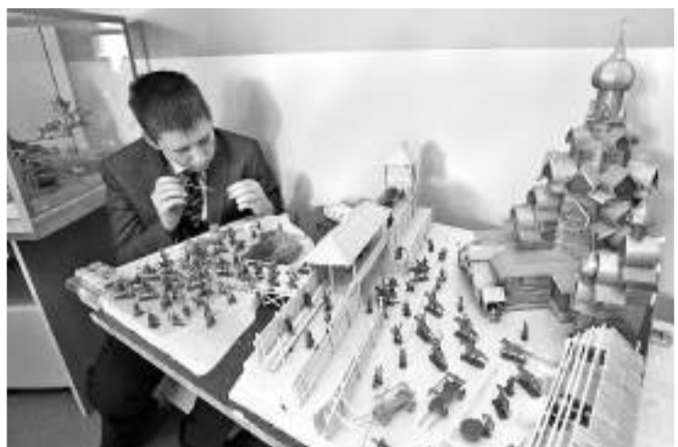
Вот такой макет старинной крепости ребята сделали своими руками