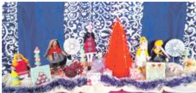
Подделки ребят из объединения «Умелые ручки»