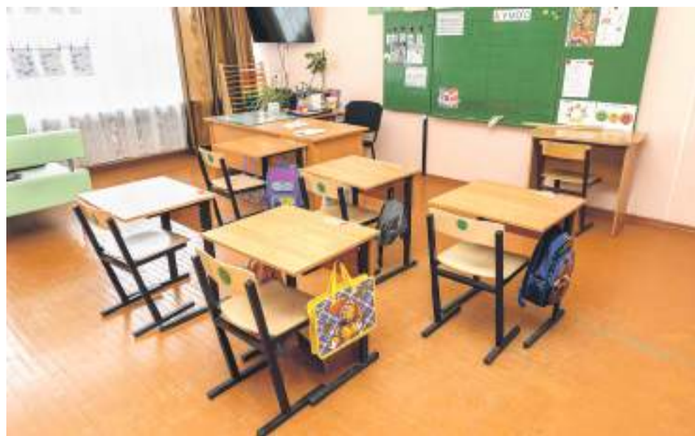
Класс для учеников с тяжёлыми интеллектуальными отклонениями

Слово «социализация» — слишком серьёзное, безликое, официальное. Но означает оно очень многое. Фактически — всю жизнь ребят в школе-интернате. Многие «особенные» дети совсем по-другому