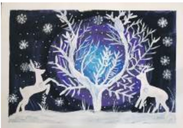
«Зимняя сказка». Рисунок Алексея Чудных (руководитель Дина Кислицца)