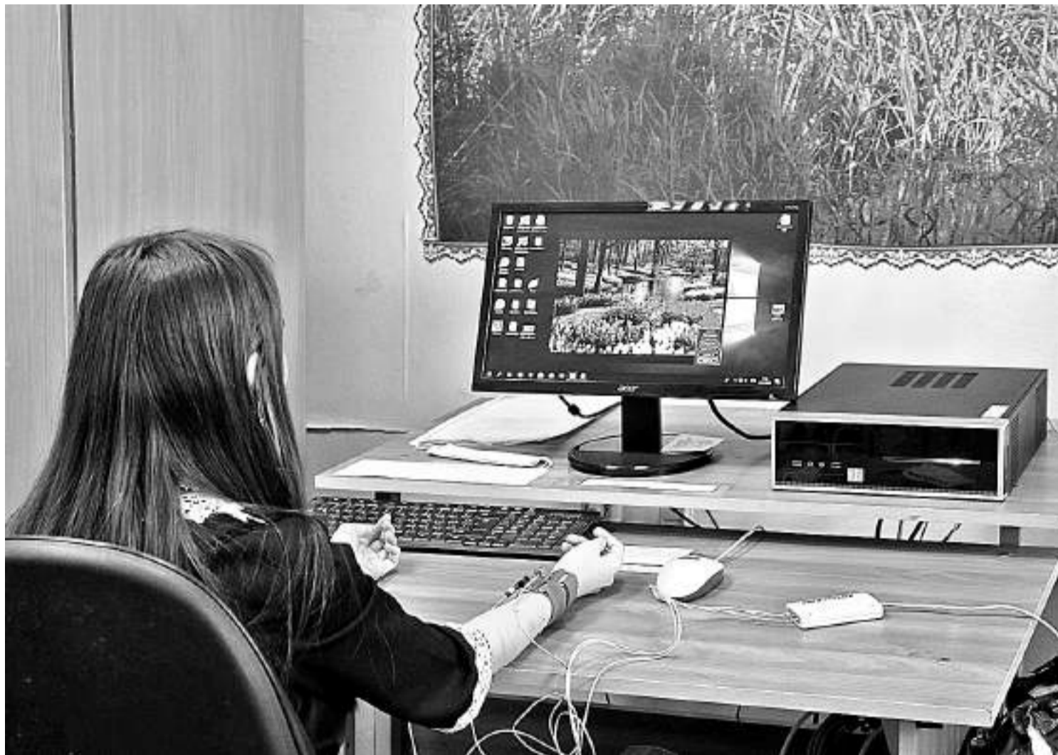
На занятии в кабинете БОС-здоровье

КАК КОРОЧАНСКАЯ ШКОЛА-ИНТЕРНАТ ДАЁТ ПУТЁВКУ В ЖИЗНЬ ДЕТЯМ С НАРУШЕНИЯМИ РЕЧИ