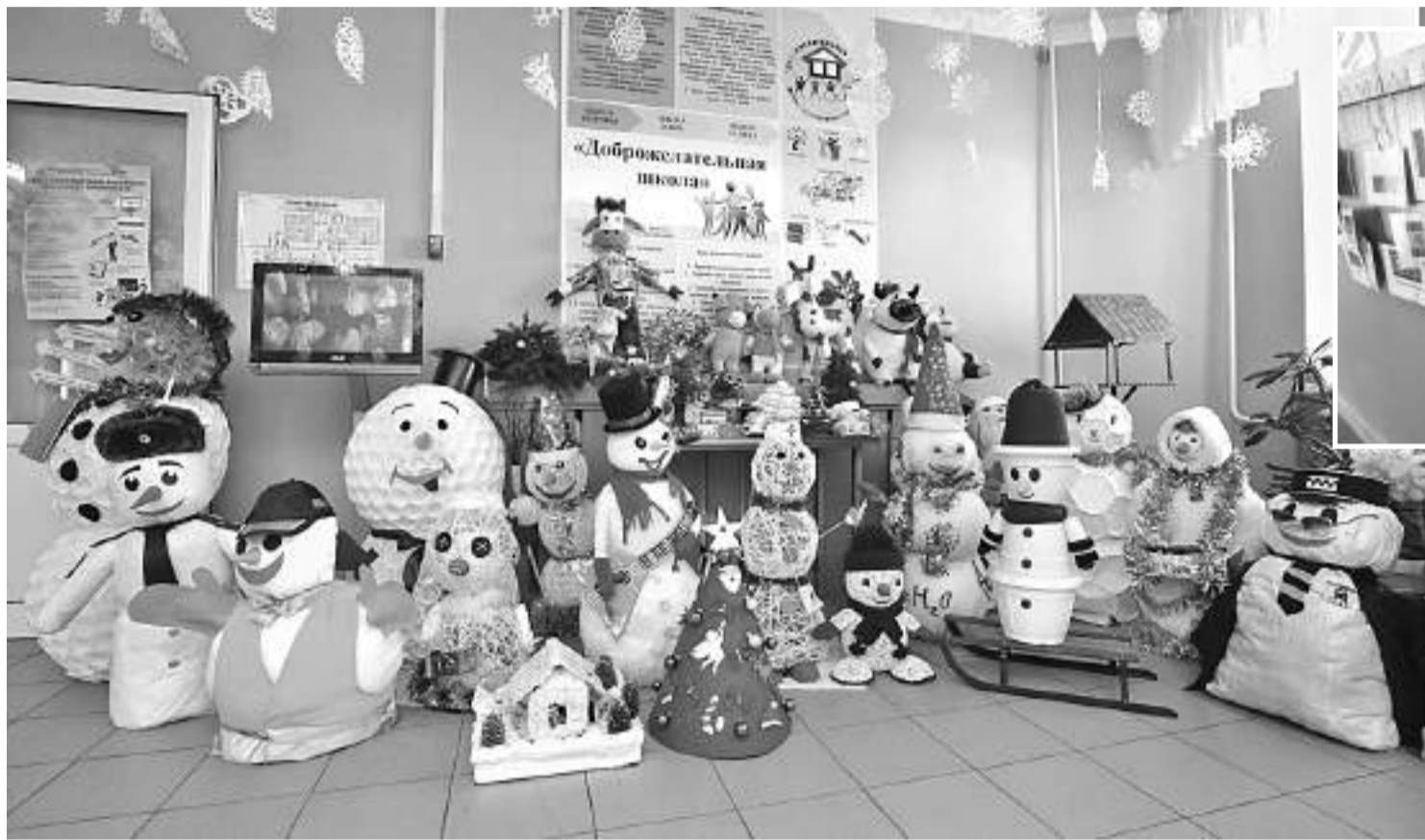
Оформление стен и рекреаций Гостищевской школы Яковлевского округа создаёт новогоднее настроение