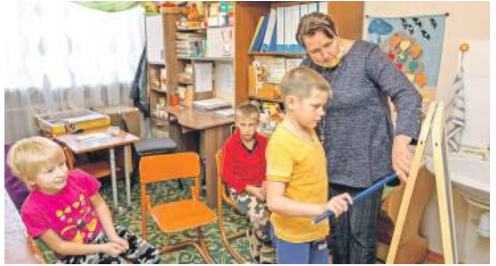
Творческие занятия на внеурочке