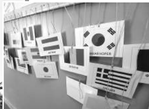
Уголок страноведения в Ивнянской школе № 1