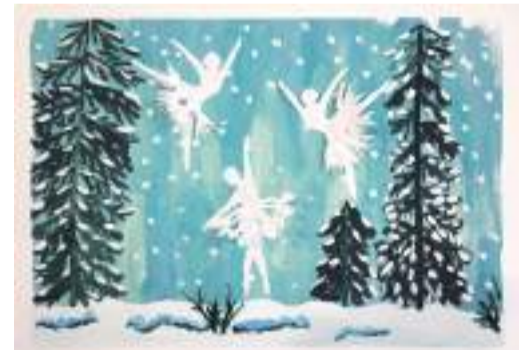
Коллективная работа объединения «Бумажные фантазии»