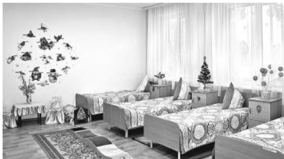
Спальная комната учеников начальных классов

классов ещё учатся в межшкольном учебном центре на водителей категории В.