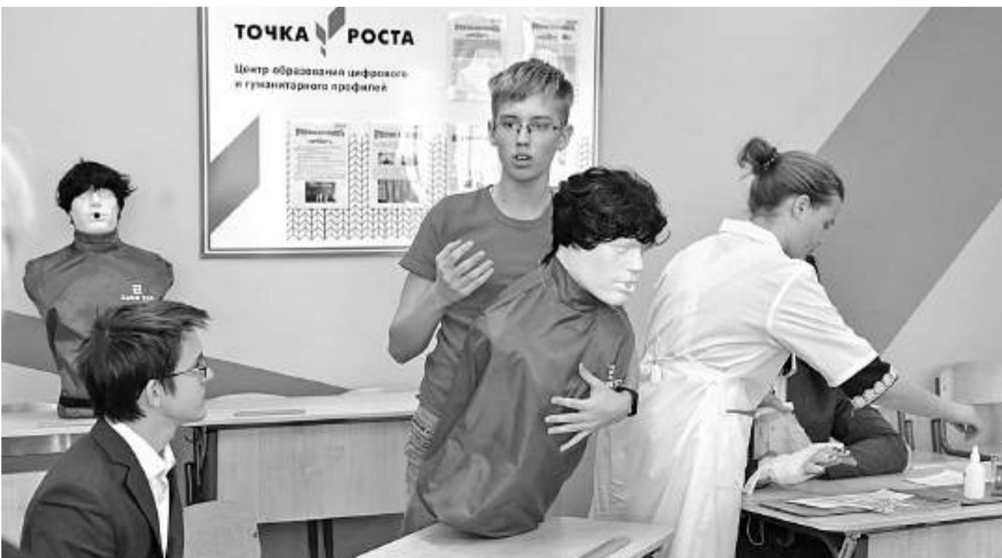
Оказывать первую помощь пострадавшим школьники учатся на манекенах-тренажёрах