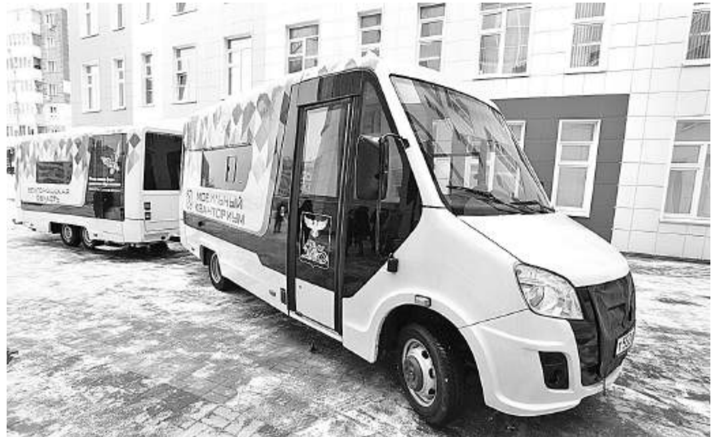
Мобильный технопарк «Кванториум»

КАК МОБИЛЬНЫЙ «КВАНТОРИУМ» ПОМОГ ОХВАТИТЬ ДОПОБРАЗОВАНИЕМ ТЕХНИЧЕСКОЙ НАПРАВЛЕННОСТИ УЧЕНИКОВ СЕЛЬСКИХ ШКОЛ