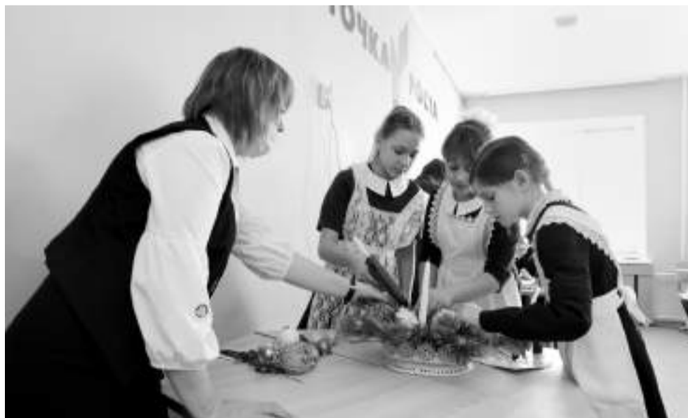
Девчонки из кружка «Станем волшебниками» за несколько минут создали новогоднюю композицию