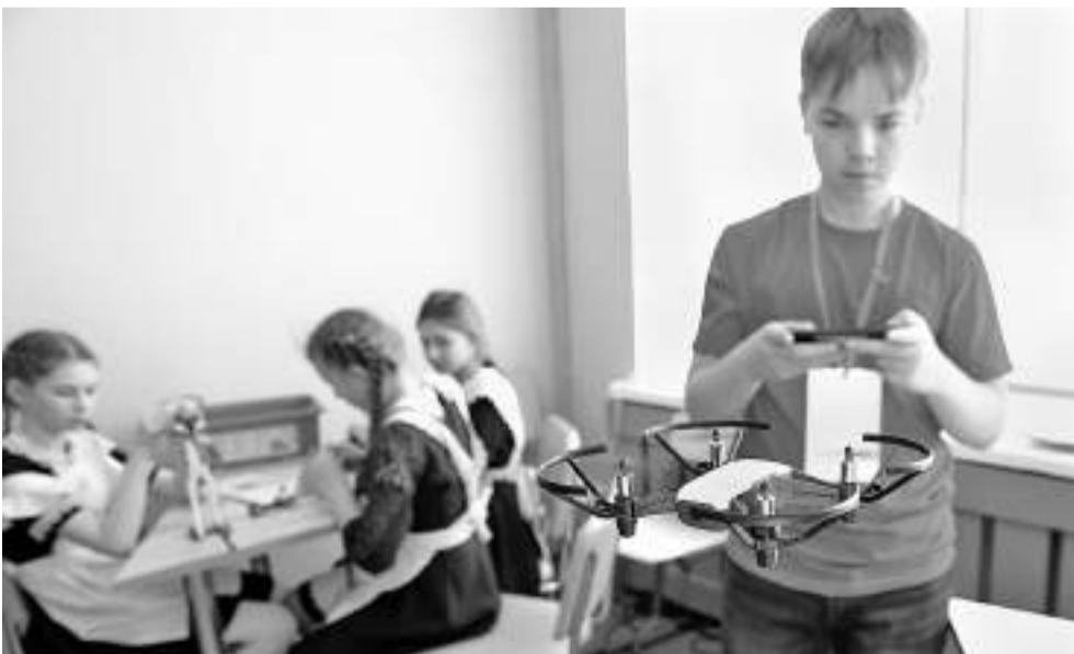
Запуск квадрокоптеров — любимое занятие мальчишек