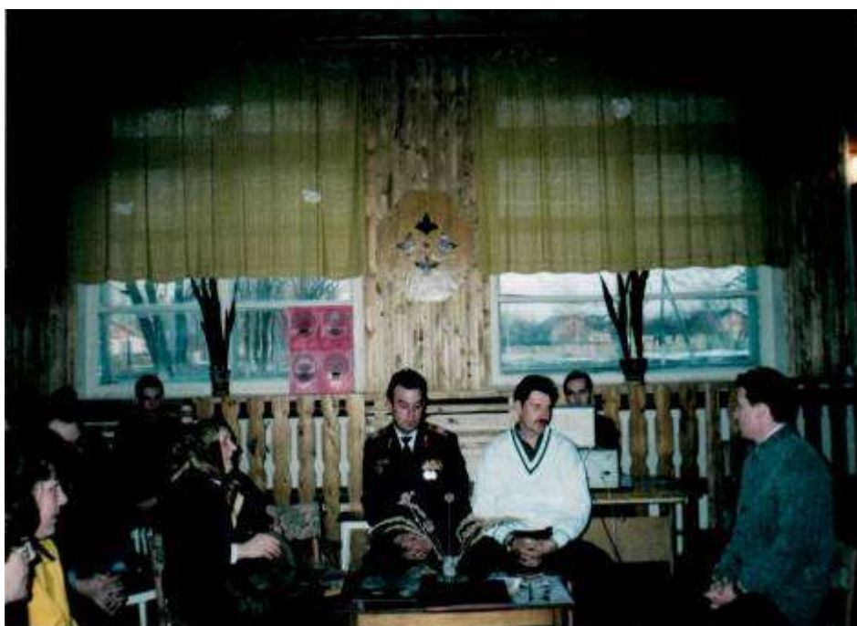
Февраль 1999г. В гостях у клуба «Патриот» воины-интернационалисты – выпускники школы.

Ведущей педагогической идеей работы клуба «Патриот» было и остаётся по сегодняшний день - создание оптимальных условий для формирования в детях стремления быть полезным обществу, в котором они живут, необходимость воспитывать людей, способных к альтруистическому отношению к жизни, людей, способных жить и творить ради блага окружающих.