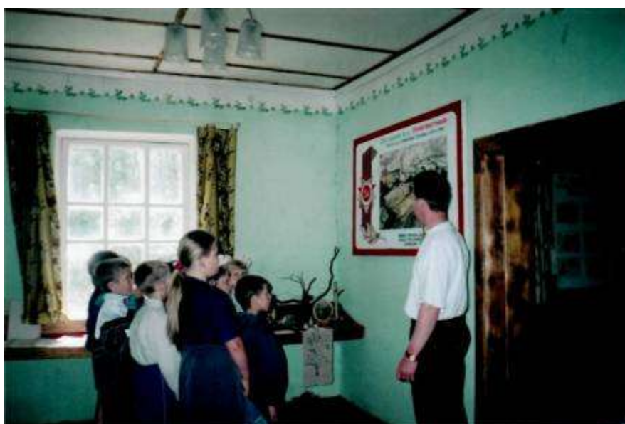
Занятие по программе «Школа кадета» по разделу «История»