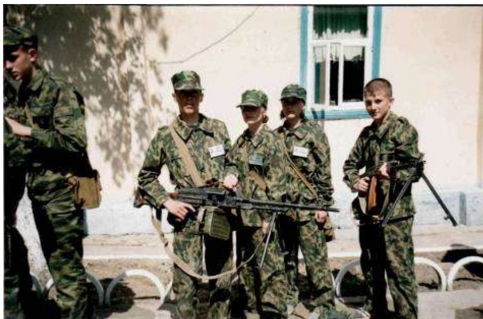
Курсанты клуба постигают азы военной службы

Ведущей педагогической идеей работы клуба «Патриот» было и остаётся по сегодняшний день - создание оптимальных условий для формирования в детях стремления быть полезным обществу, в котором они живут, необходимость воспитывать людей, способных к альтруистическому отношению к жизни, людей, способных жить и творить ради блага окружающих.