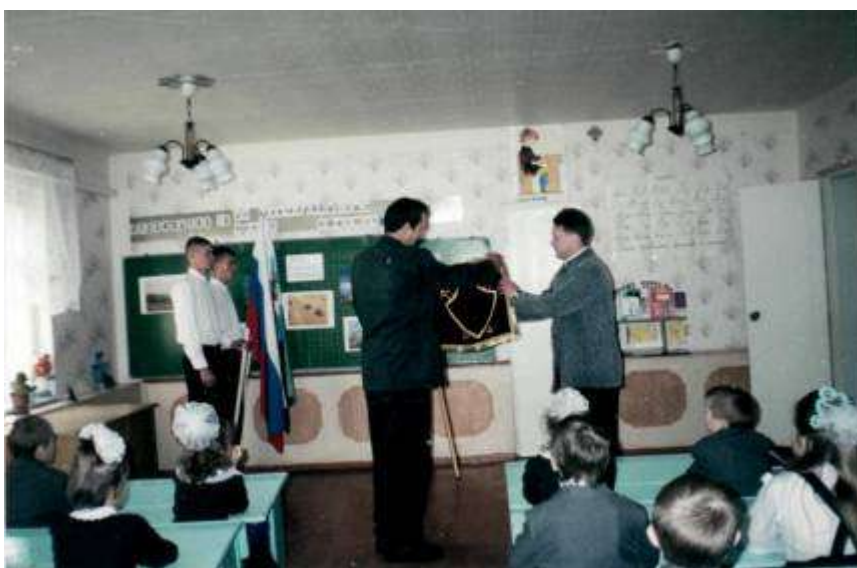
Глава администрации вручает кадетам Знамя класса