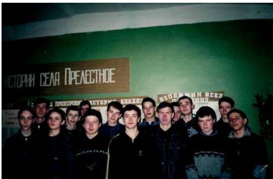
1996 год. Первые курсанты клуба «Патриот».

В октябре 1996 года в Прелестненской средней школе был создан первый в Прохоровском районе школьный военно-патриотический клуб «Патриот».