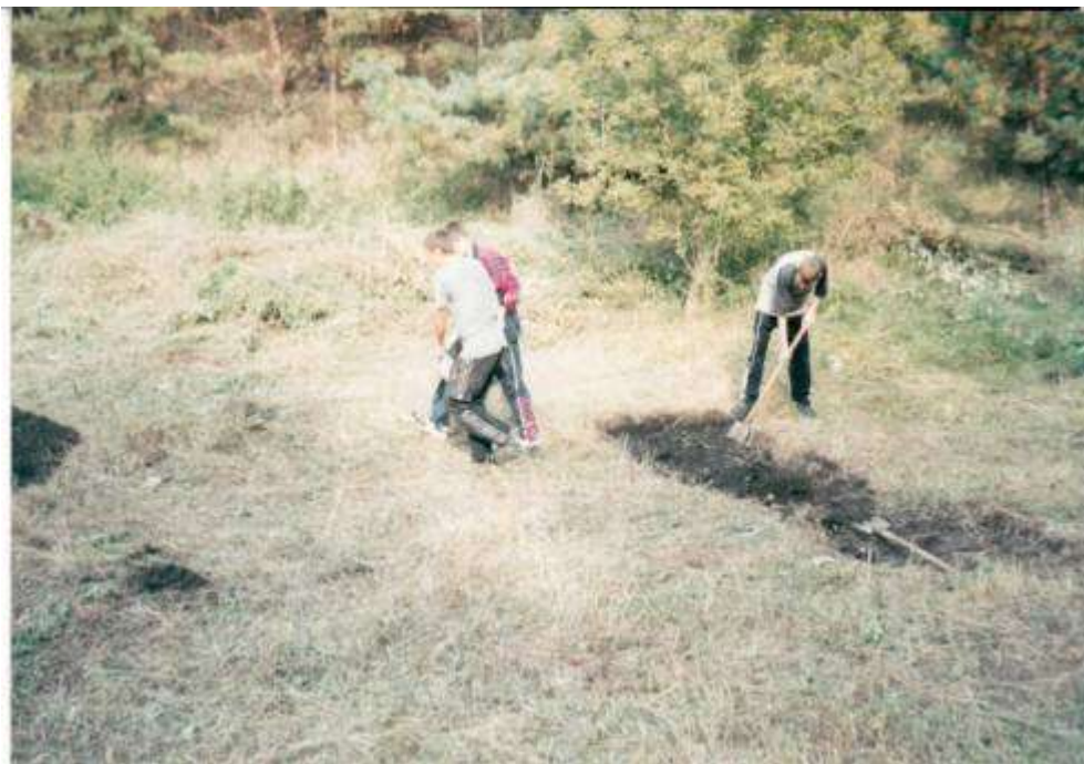
Изготовление полосы препятствий для проведения районной «Зарницы»

Клуб «Патриот» стал инициатором возрождения в районе военно-спортивной игры «Зарница».