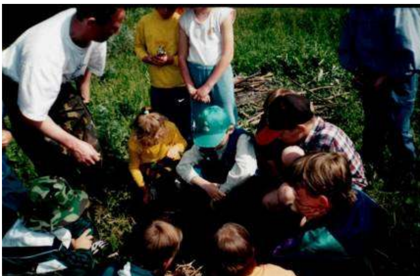
Занятие по программе «Школа кадета» по разделу «Автономия»