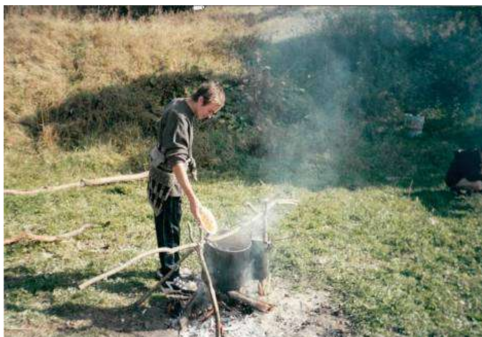
Походы по родному краю