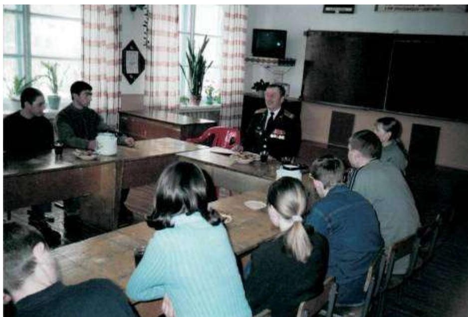
Встречи с людьми героических профессий

Интересная, насыщенная событиями жизнь клуба «Патриот» с каждым годом стала привлекать к себе всё большее внимание окружающих. В первую очередь родителям нравилось то, что их дети заняты хорошим, полезным делом, с интересом проводят своё свободное время, укрепляют здоровье, расширяют кругозор, приучаются к общественно полезной деятельности.