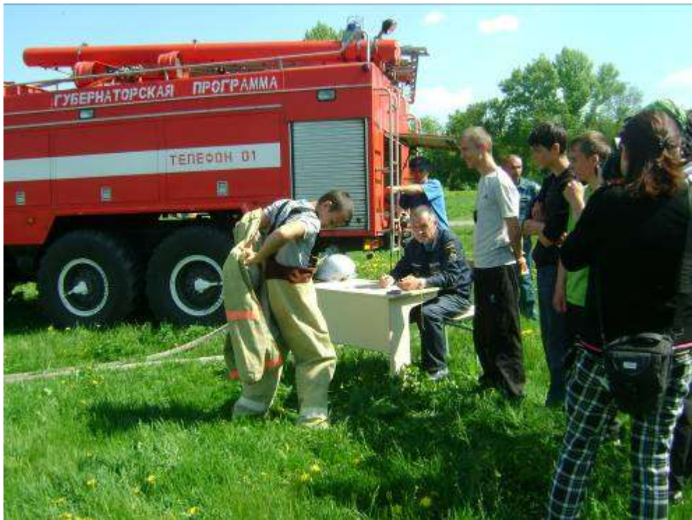
Пожарный этап игры «Зарница»