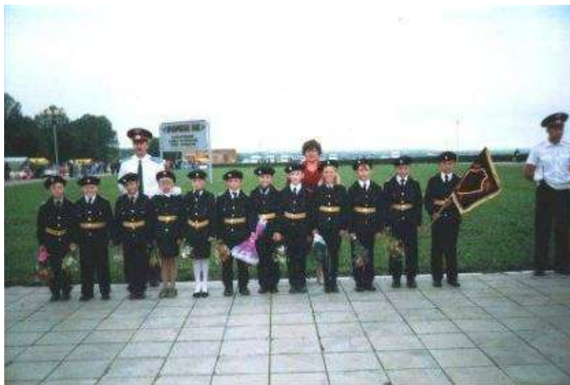
2001 год. Первый кадетский класс в Прохоровском районе

Много было споров и различных суждений, раздумий «за», «против» и вот наконец родители будущих кадет сказали своё веское слово – «кадетам быть» и в Прелестненской средней школе 1 сентября 2001 года был создан первый в Прохоровском районе кадетский класс. Его особенность заключается в том, что кадетское образование охватывает начальное, среднее и старшее звено общеобразовательной школы. Занятия проводятся в рамках дополнительных образовательных программ, имеющих целью специальную подготовку и оздоровление детей. Это был первый опыт, когда кадетами стали первоклашки. С 2001 года и по сегодняшний день кадетский милицейский класс работает по программе школы полного дня.