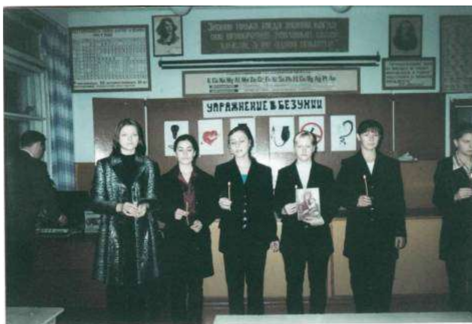
1996 год. Первые курсанты клуба «Патриот».

Его курсантами стали юноши - учащиеся 8 – 11 классов, которые изъявили желание подготовиться к службе в рядах Вооружённых Сил. Но не прошло и полугода, как в клуб захотели вступить и девушки, внимание которых привлекли походы по родному краю, экскурсионные поездки, общественно полезная деятельность курсантов клуба.