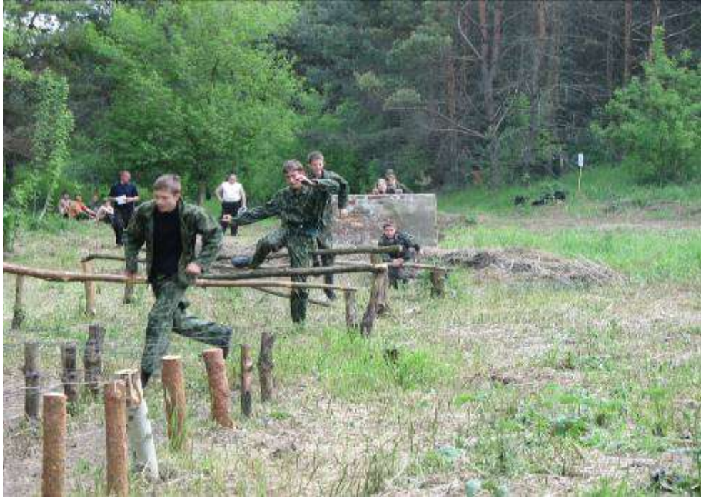
Участники игры «Зарница» штурмуют полосу препятствий