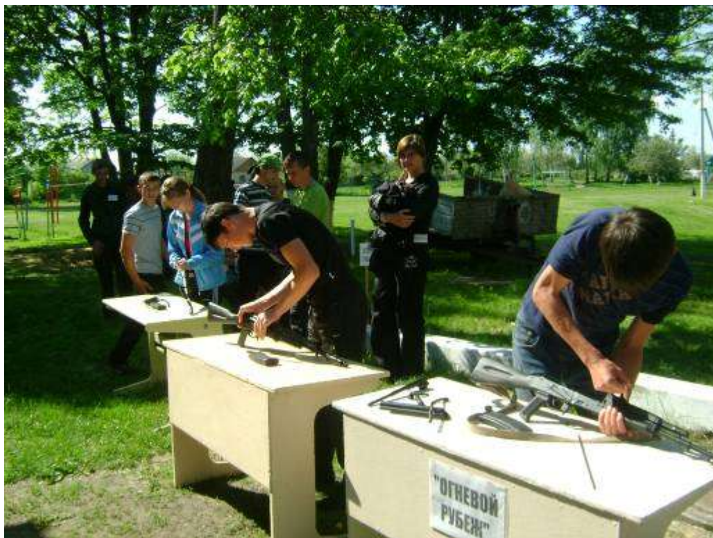
Разборка-сборка АК на время